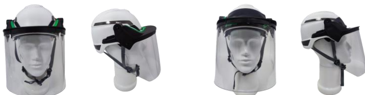
V-GARD molded Visor Proprionate clear 10115855 avec casque with helmet V-GARD H1 et porte-écran and frame 10236392